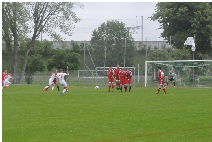
Spiel gegen ein Fussballteam von Coca-Cola Schweiz in Brütisellen

Zum Tagesabschluss spielten die Schweizer Fussballköche ein Freundschaftsspiel gegen ein gutes Team von Coca-Cola Schweiz.